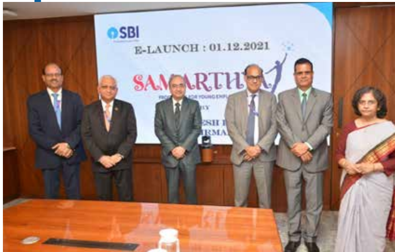
आपके बैंक के शीर्ष प्रबंधन द्वारा सामर्थ्य का ई-लॉन्च

स्मार्ट कक्षाएं: देश भर में बैंक के प्रशासनिक, क्षेत्रीय और स्थानीय प्रधान कार्यालयों में नया स्मार्ट क्लासरूम अवसंरचना बनाई गई है। महामारी के अवरोधों में काम करते हुए भी इस व्यवस्था ने नई प्रशिक्षण क्षमताओं को उजागर किया है। एक दिन में 2000 से अधिक कर्मचारियों को प्रशिक्षण प्रदान करने वाले 400